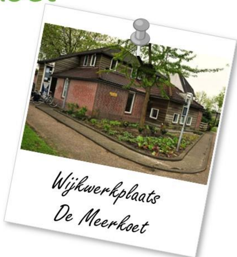
Wijkwerkplaats De Meerkoet

Gebruikers Meerkoet: De Weidevogels, KBO/PCOB, Haag en Hof, Gym voor ouderen, Contact Club Houten